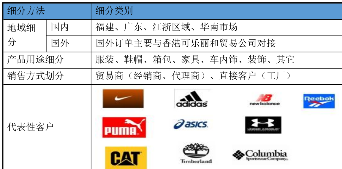
表 1 顾客群、细分市场综合分类

公司主营业务为合成革产品的研发、生产和销售，应用范围较广，包括家具、鞋材、箱包、车用、服装及包装等。基于合成革的行业特性，内销市场主要以福建、广东及江浙区域为主，外销市场主要与香港可乐丽和贸易公司对接。对顾客群和市场细分主要按区域、产品用途、销售方式和顾客等级等进行划分。